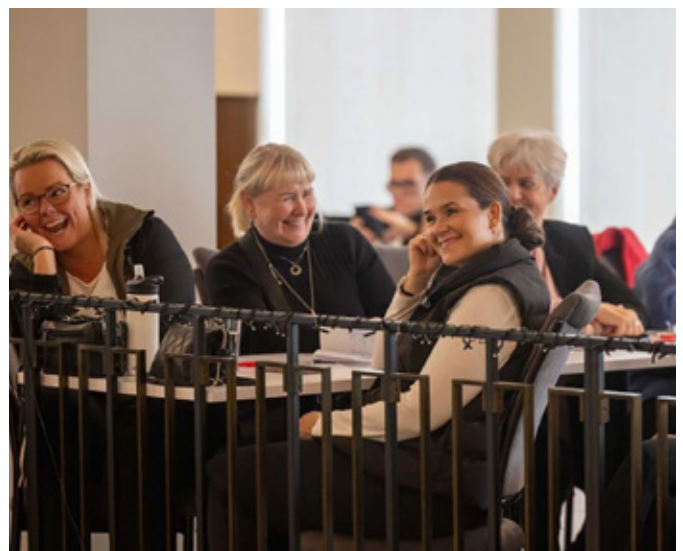
Fróðleg erindi og líka skemmtileg!

„Í ljósi góðrar reynslu af þessari dagskrá stefnum við á að halda hliðstæðan fræðsludag í september í haust fyrir félagsfólk okkar